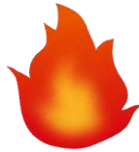
鶴見線営業所分会